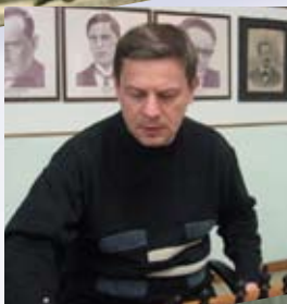
Crespi 2011 - V. Shishkin