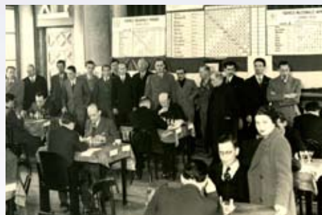
Crespi 1938 - Fasi di gioco