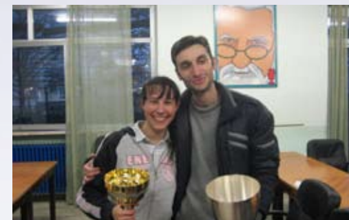
Crespi 2011 - I vincitori

ASSOCIAZIONE SPORTIVA STORICA - FONDATA NEL 1881