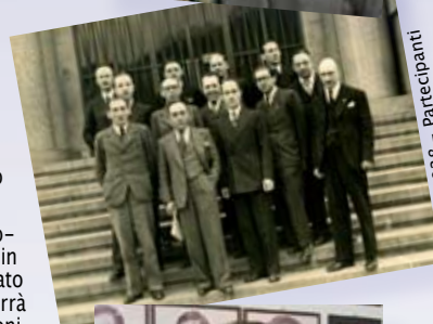
Crespi 1938 - Partecipanti